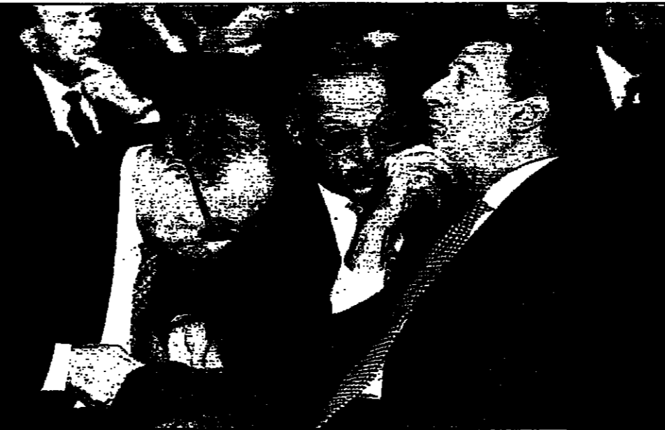
وزير الخارجية المصري عمرو موسى يرحب مع سفيره في القاهرة وزير الخارجية العربي في القاهرة (أسير)

القاهرة - ويوتيرز: بدأ وزراء خارجية دول جامعة الدول العربية اجتماعاً في القاهرة أمس الأربعاء وسبقه يومين وتناولوا أسرار القدس ووزير الخارجية السوري الذي يرأس الدورة الحالية في كلمته بالجامعة الانتخابية أسير وزراء خارجية الدول الأعضاء بجماعة الدول العربية والجمعين في القاهرة أسير الوزراء التعاون العسكري بين إسرائيل وتركيا.